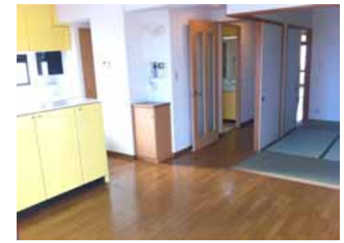
人気のカウンターキッチン♪ 3口コンロ・食洗機付き