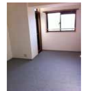
西側洋室 お子様のお部屋や 書斎としてもオススメ!

採光 良好です 通風 3面 バルコニー オート ロック 学校区 北小学校 北中学校